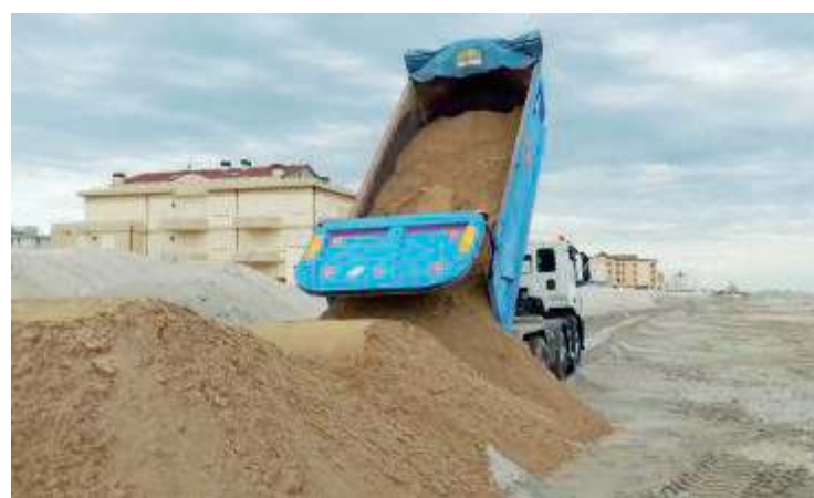
Arrivati a Misano migliaia di metri cubi di sabbia per il ripascimento

È partito ieri il ripascimento con la stesura di circa 7.500 metri cubi di sabbia, a cura dell'Agenzia regionale per la sicurezza territoriale e la Protezione civile. L'intervento rientra nel bando regionale nel quale sono stati stanziati 380.000 euro. La sabbia proviene dalle dune di protezione dell'arenile realizzate a Rimini e sarà posizionata nelle zone di spiaggia fra Misano centro e sud. Un primo intervento è già stato fatto nella spiaggia a nord di Misano. Dopo l'estate prenderà invece il via, tramite un bando della Regione di 400.000 euro, la realizzazione di un progetto sperimentale con barriere soffici nella zona criti-